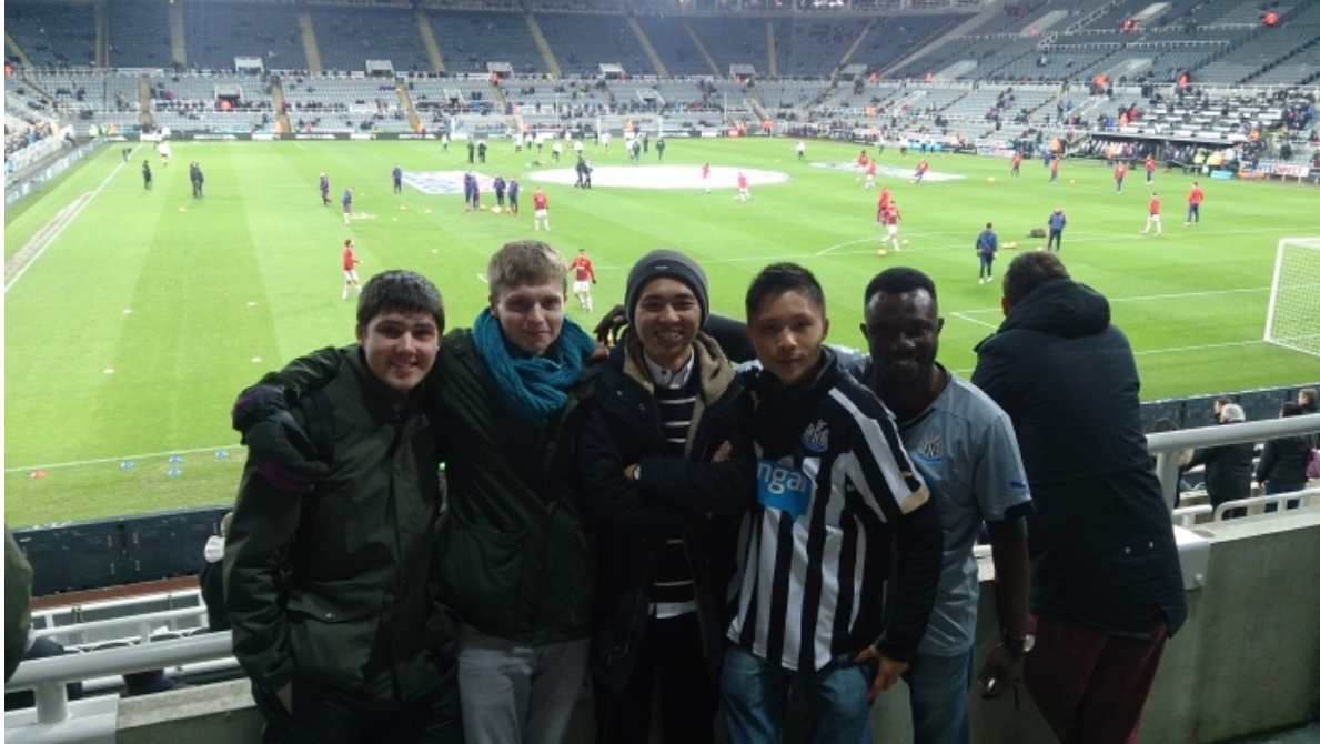
St James Park, Newcastle upon Tyne